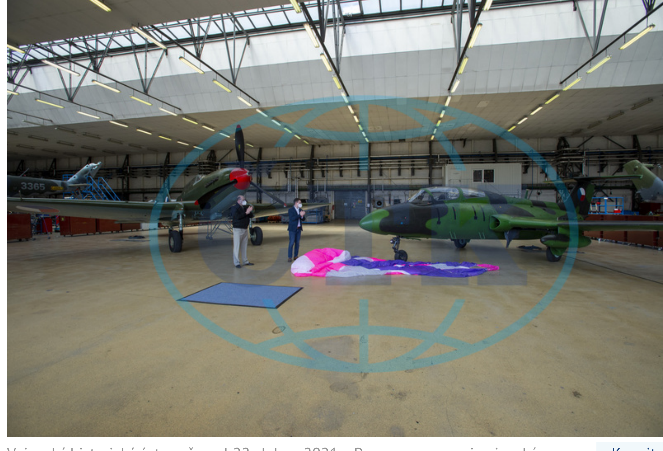
Vojský historický útav převzal 22. dubna 2021 v Praze po renovaci vojenský proudový cvičný letoun Aero L-29 Delfin (vpravo) a cvičný bitevní letoun Avia CB-33 (l-10).

Aktualizace: 22.04.2021 16:31 Vydané: 22.04.2021, 16:31