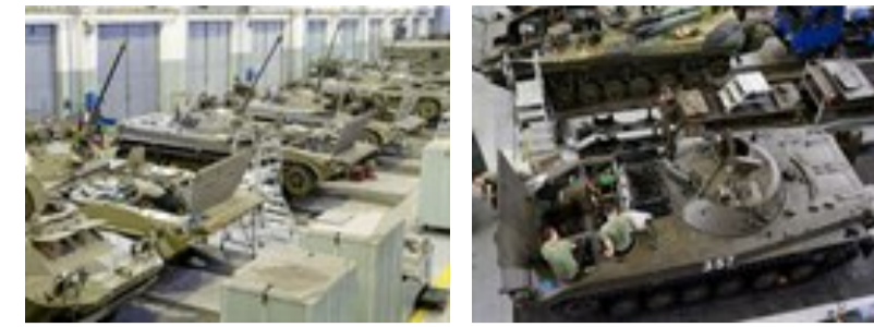
Armáda oživila stará BVP ze skladů