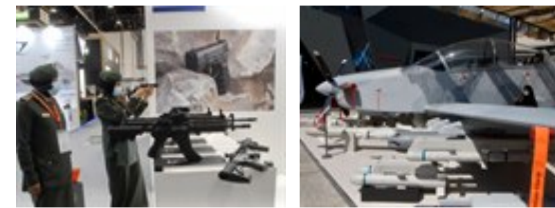
Obří veletrh v době covidu