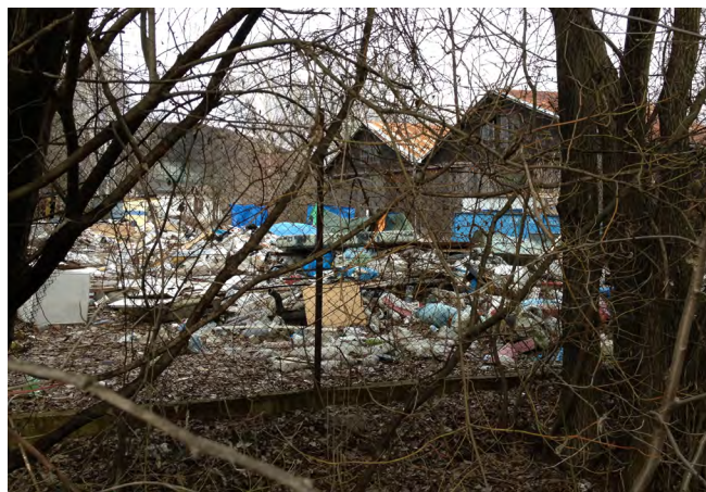
Na horních snímcích vidíte stav „před“, níže „po“.