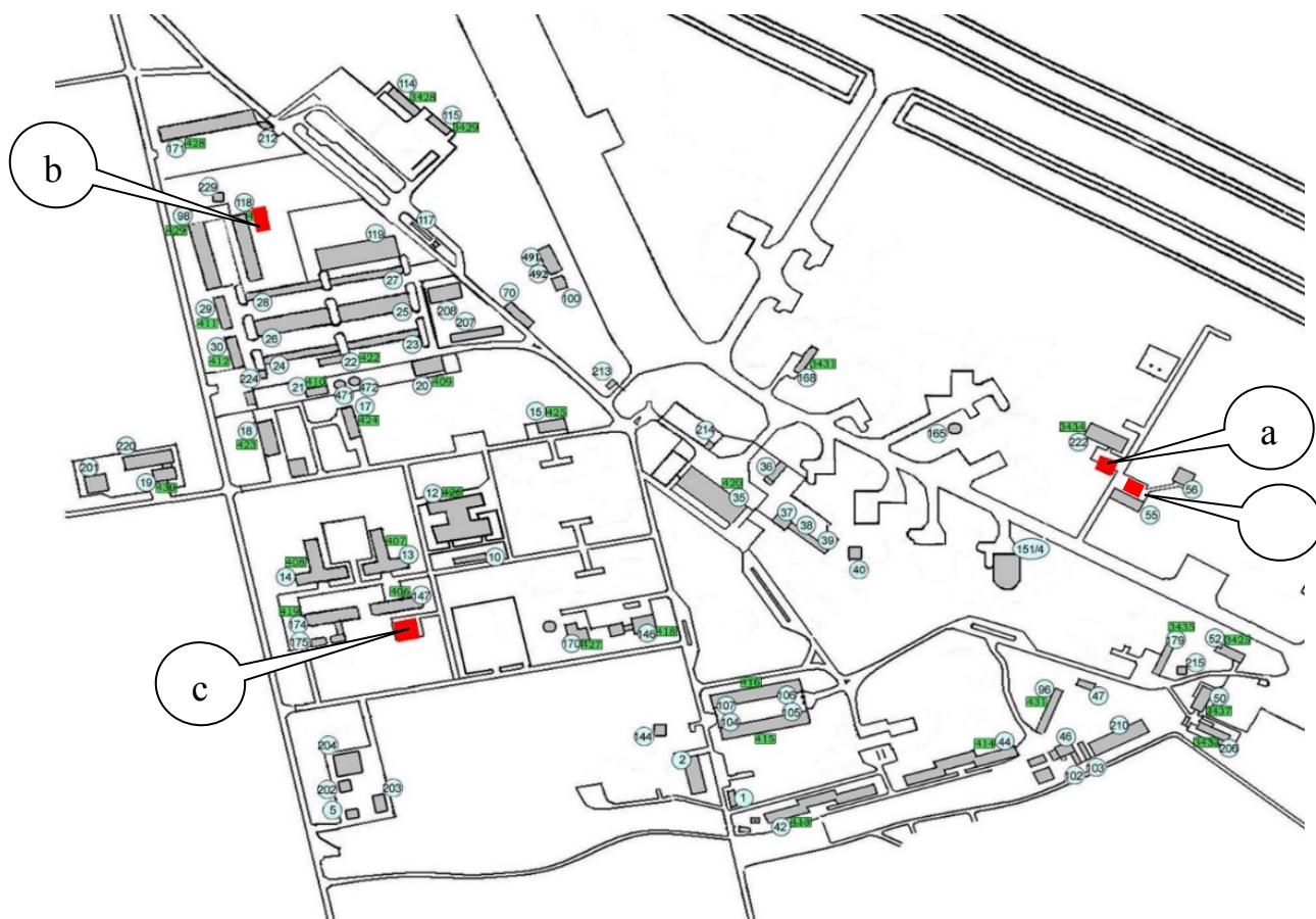
Obr. č. 2 – Místa pro trvalé parkování zaměstnanců letiště Přerov